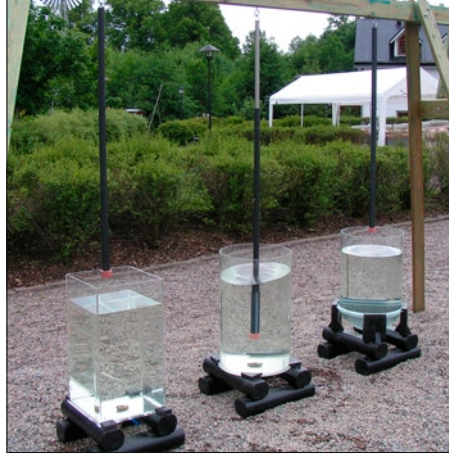
F02 Rör om i tre.