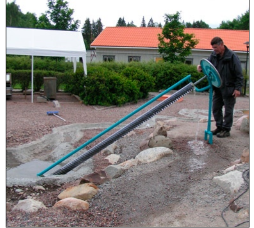
F03 Arcimedes skruv.