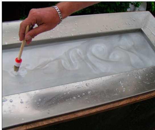
F 05 Virvelgata.