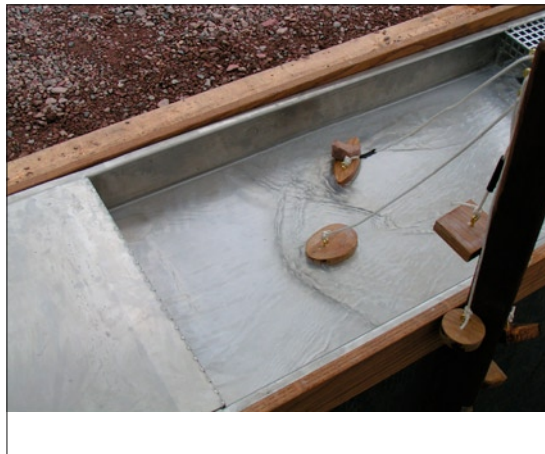
F 07 Da Vinci bord.