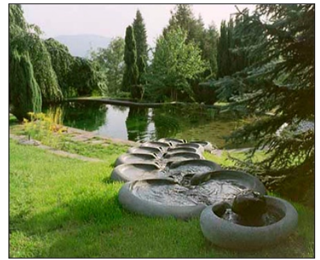
Planering av parkanläggningar. Här en Akalla vattentrappa.

Virbela Ateljé, Mölnbovägen 25 K, 153 32 Järna TEL: 08 551 50 335 MAIL: virbela@flowforms.se WEBB: www.flowforms.se