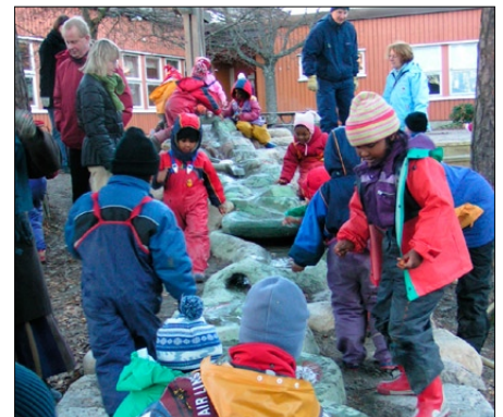
Lekbäckar för skolor och daghem.