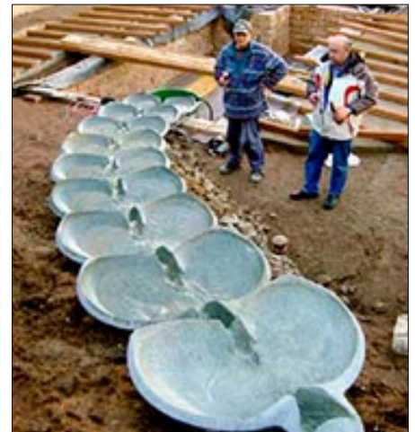
Vi hjälper kunden med projekteringen.