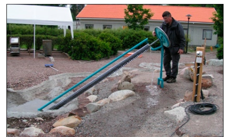
Fenomenmontrar för upplevelsecentra.