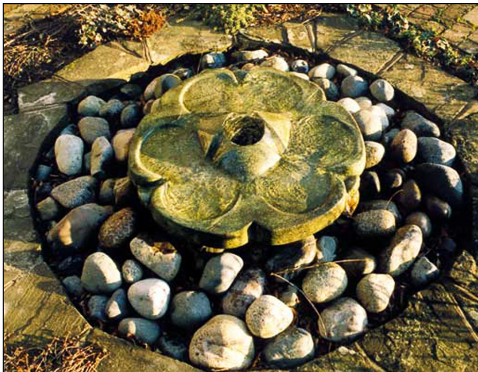
Ashdown placerad i en trädgård.

En radial symmetrisk form med tre Flowforms som svämmar över i varandra. Hela stenen blöts. Den har tre tydliga vattenfall vid utloppen som ger ett lätt porlande ljud. Ashdown kommer bäst till sin rätt om den monteras i vattenspegeln av en damm. Design av John Wilkes and Nigel Wells.